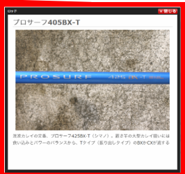
オーバーレイで表示する商品画像などアップする画像点数は非常に多い