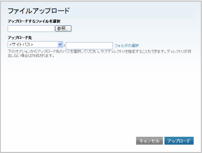
ファイルマネージャーでは1点ずつしかアップできない

続いて課題となっていたのは、操作面ではなく、大きな労力がかかっていたファイル（画像）管理部分。